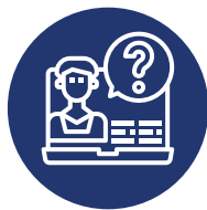
Pericias médico laborales